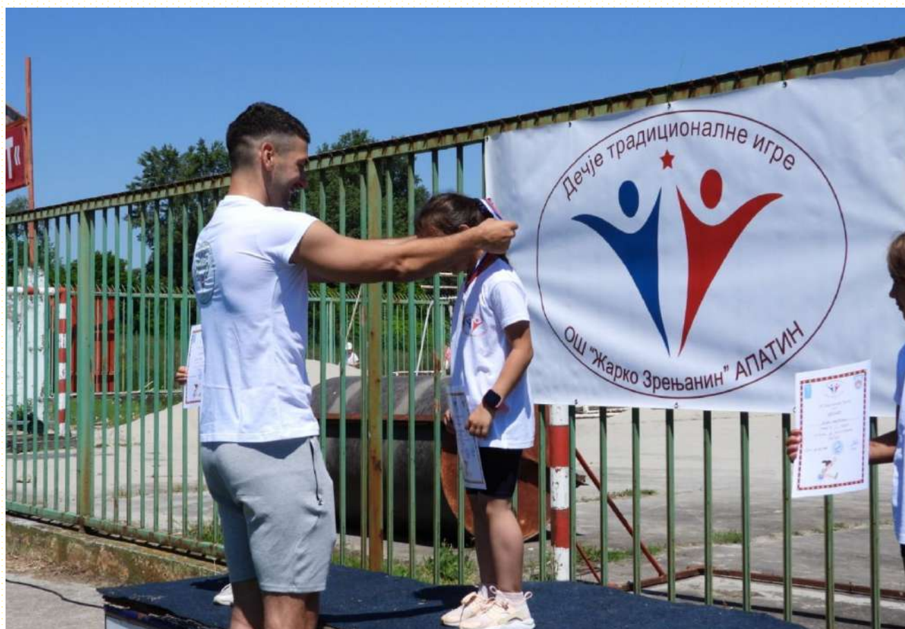
Наш прослављени рукометни репрезентативац Предраг Вејин уручује медаље најбољим такмичарима на Дечјим традиционалним играма.

Жалбе на такмичење могу се приложити одмах након трке (главном судији или спортском координатору такмичења) најдуже 5 минута након трке. Жалбе након тога неће бити прихваћене.